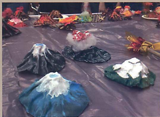
學員各式各樣的內在火山