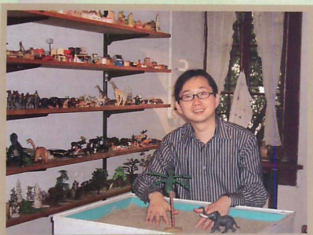
造訪 Dora Kalff 之沙遊室