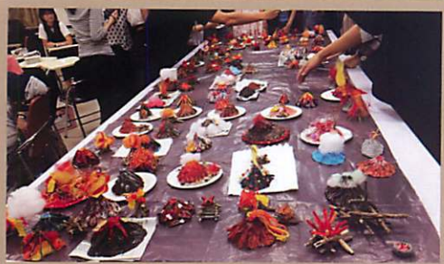
學員心中各式各樣的火山成形

這次參加沙遊學會的工作坊，體驗製作火及火山的物件，原先抱持著參與手工藝課的心情，製作過程中有些挫折，卻也得到意外的收穫。