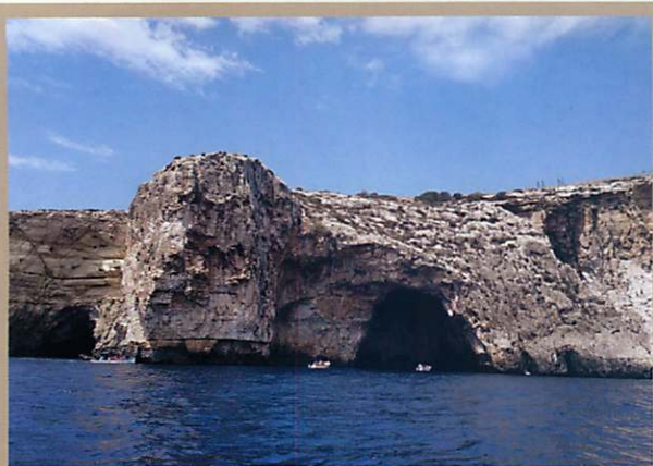
搭乘小船進入宛若潛意識冰山下的藍洞