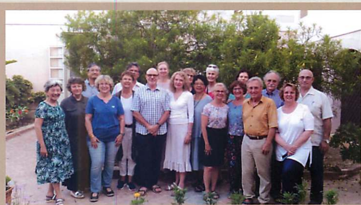
與 Malta 出席夥伴合影

長話短說, 術後回家的最初一段時間才是我人生中最令人難忘的經驗。醫師家庭出身的我馬上成為24小時的看護; 照顧一個比我大24公斤的Baby, 不能動, 難翻身, 且需在床上穿好背架才可下床, 下床還需扶住, 每一動作都需幫忙, 唯恐會跌倒, 還有小腿與膝蓋神經痛時需按摩, 上貼布。要找到幫忙的看護或居家服務員需時間, 因此術後最初的兩三禮拜是我從心理師轉變為馬上需學會之照顧病人、沒有別人輪班的護士及物理治療師。76歲的我忙得身體到處痛; 但有了人生的第二春(新行業)也算是幸運吧! 真的不怕無頭路(台語發音)了。哈! 寫的太長, 欲知下事, 請待下回分解!