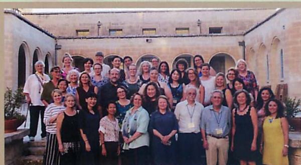
工作坊結束前全體合影

揀來、馬上提供該成員可能用得到的沙遊相關書籍與期刊資源內容，並一針見血地提出建言，是需要廣義地搜尋象徵物件的生物特徵及歷史文化意義，抑或是需要限縮象徵物件意涵，完全視學員的狀況而有不同的建議。我在整個工作坊都不太敢與心中仰之彌高的巨擘交談，終於在最後一個晚上、Give away ceremony之前，看到她提前離開晚宴準備卻因教室上鎖未能進入而獨坐在門外，終於鼓起勇氣邀請她一起合照，意外地在昏黃的燈光下捕捉到她慈祥和諧的笑容。巧合的是，在後續的Give away ceremony中是由Lenore拿到了我所準備的冠軍獎盃！