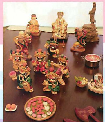
夥伴分享台灣民間故事小物件

二年的沙遊讀書會，雖然已暫告結束，但能與沙遊同好們共聚一堂，彼此分享在沙遊領域的學習經驗與生命故事，對我而言，除了有知性的刺激與成長外，還有夥伴同行的陪伴與回憶，很感謝生命中能有這樣的體驗與學習，期待下一期讀書會的開跑！