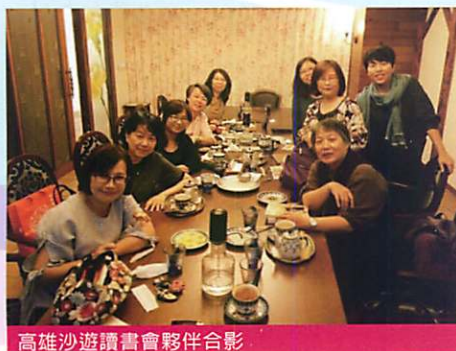
高雄沙遊讀書會夥伴合影

讀書會地點是挑在一個很有放鬆氛圍咖啡廳，聚會形式包括導讀、分享和討論，而每次的主題由不同導讀者依主題性質設計要討論的形式並指定特定的閱讀範圍或參考書目給成員做預覽。於是，每次的聚會總是在嘴裡吃喝著美食、腦子激盪著各種新知的狀況下，獲得身心滿滿的飽足感！