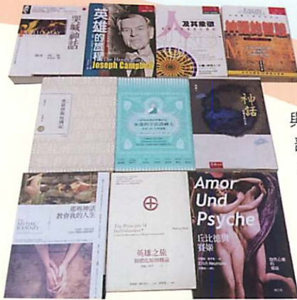
讀書會涉獵之部份讀本

讀書會的進度包括原定的「何謂神話--神話的起源」、「神話中的宇宙--開天闢地與源起」、「神話中的主角--男神、女神、人類英雄、怪物、惡魔和動物」、「神話中的戰爭--諸神交戰、天人交戰」、「神話中的人間歷險」、「神話中的英雄之旅」、「神話中的愛情」、「神話中的親情」、「神話中的中年過渡」、「神話中的生與死」、「綜合討論」，最後再加碼「神話與尋根」、「神話與心理治療」、「神話與沙遊治療」，由原本預計完的2017年11月，延長至2018年5月，這雙月一會的讀書會，劃下令人意猶未盡的休止符。