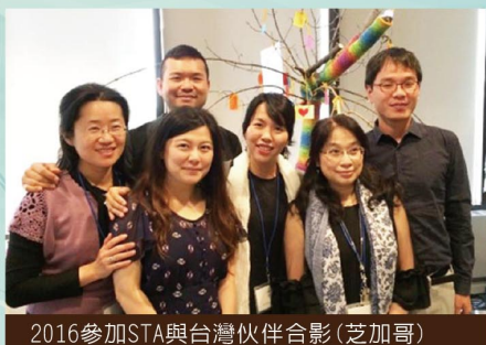
2016參加STA與台灣伙伴合影(芝加哥)

去年秋天，我離開在台灣的全職臨床心理師生活，來到美國舊金山灣區讀書，雖說初衷是希望有機會在資源更多的地方繼續學習沙遊，但語言、文化適應和跟上學校課業用盡我第一年的力氣，各方面只能量力而為。很感激有這個機會寫寫這年在沙遊學習方面的經歷，也作個小小的回顧。