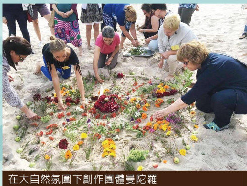
在大自然氛圍下創作團體曼陀羅

當然這裡也是認識國際沙遊同好的絕佳機會，即使參與者並非都說流利的英文，但微笑和主動永遠是表達善意的最佳利器。我真的想不到，我的俄羅斯朋友居然給了我她的email address、手機號碼和skype 帳號，還答應若我到俄羅斯旅行，她要當地陪！當然，也碰到跟我一樣正在努力產出final case 的朋友，交換彼此寫作的心得，也紓解了認證路上漫長的煎熬。