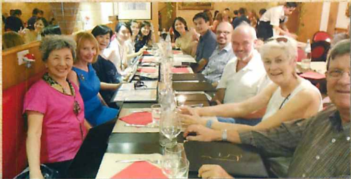
圖二：沙學與勵馨共同舉辦成為ISST會員國的慶祝餐會